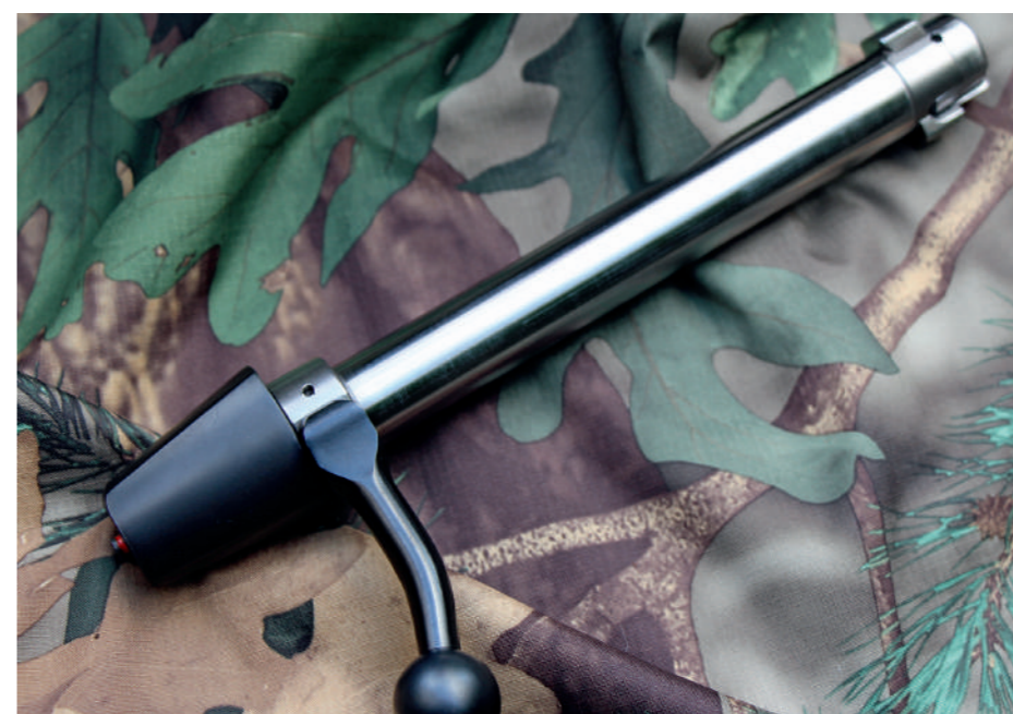
O ferrolho possui dois trincos de grandes dimensões na cabeça e conta com mecanismo de expulsor ativo.