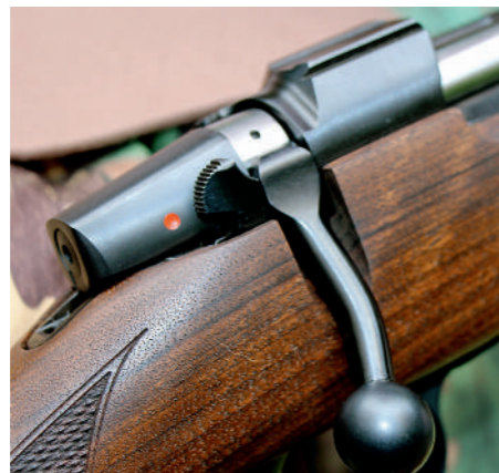
A patilha de segurança, bem localizada, e o manobrador do ferrolho, bem dimensionado.