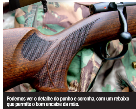
Podemos ver o detalhe do punho e coronha, com um rebaixo que permite o bom encaixe da mão.