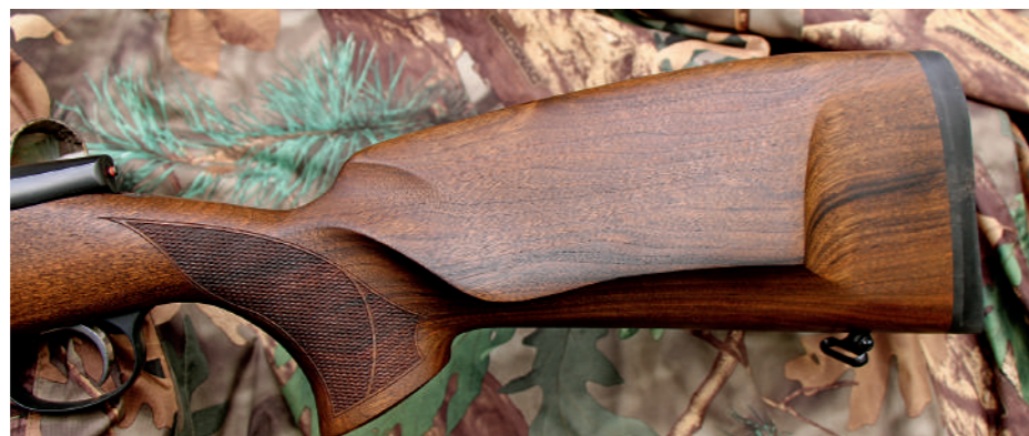
A coronha tem linhas marcadamente centro-europeias; a crista com um ligeiro dorso de javali e almofada bávara.