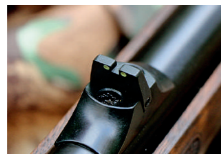
A alça em "U" é regulável em deriva e na frente temos um ponto de mira em fibra ótica e proteção.