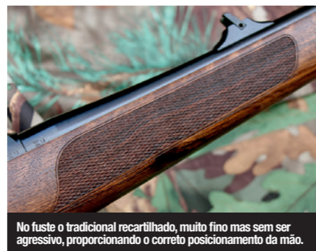
No fuste o tradicional recartilhado, muito fino mas sem ser agressivo, proporcionando o correto posicionamento da mão.