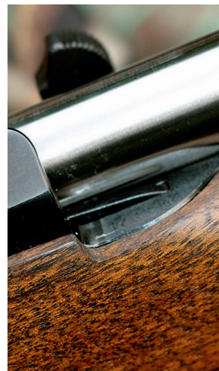
A pequena patilha que permite extrair o ferrolho.